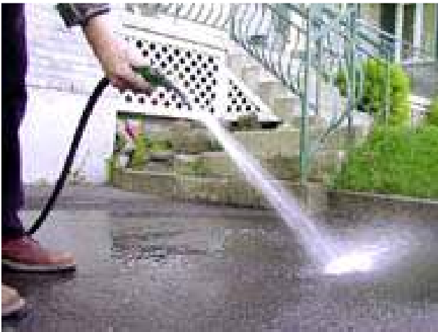
Les gestes de la vie quotidienne en valeur "eau"

Des gestes à faire pour une bonne utilisation de l'eau pour la préserver.